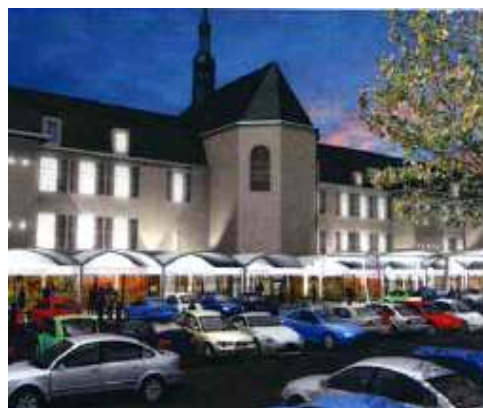
Galerie Commerciale Colbert

Des travaux d'aménagements des voiries situées autour du site sont également prévus. Ils participeront au développement commercial de la ville et à son rayonnement départemental.