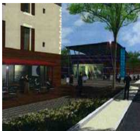
Vue de la rue Charles Roy

Elaboré en étroite collaboration avec la municipalité, ce projet prévoit notamment la réhabilitation et la mise en valeur de l'ancien Hôpital Colbert, monument classé de la seconde moitié du 17 ème siècle.